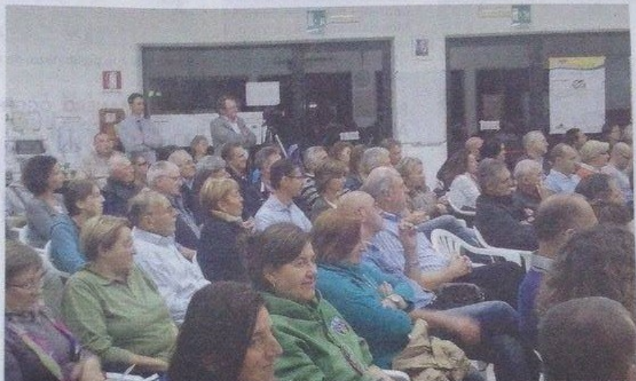
I cittadini seguono con particolare attenzione l'evolversi della vicenda legata ai progetti Eni