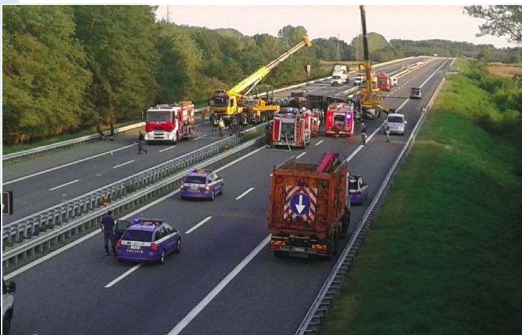
Sopra e a fianco due momenti dell'incendio avvenuto ieri pomeriggio sulla A26 nei pressi del casello di Romagnano Sesia sul territorio di Carpignano. A causare il divampare delle fiamme lo scontro tra un camion e una vettura.

ROMAGNANO (pfm) Tragedia ieri sull'autostrada A26 nei pressi di Romagnano dove ha perso la vita l'autista di un camion. Fino a sera la viabilità è rimasta bloccata. Tutto è stato causato da un incidente sulla Voltri-Sempione nella corsia in direzione di Gravellona Toce. Erano circa le 15 quando, stando a una prima ricostruzione dei fatti, un camion ha tamponato un'auto per poi rovesciarsi. Ad essere coinvolto anche un terzo veicolo. Ad aggravare la situazione poi l'incendio scoppiato nel vano motore del mezzo pesante forse a causa del surriscaldamento. E per l'autista non c'è stato nulla da fare, è rimasto intrappolato tra le lamiere senza riuscire a uscire per tempo mentre l'abitacolo prendeva fuoco.