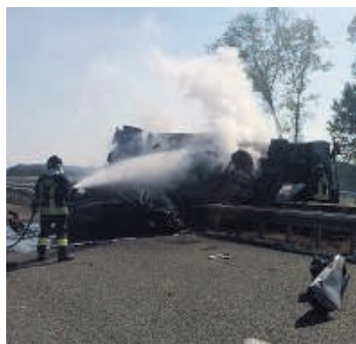
I Vigili del fuoco mentre spengono il rogo